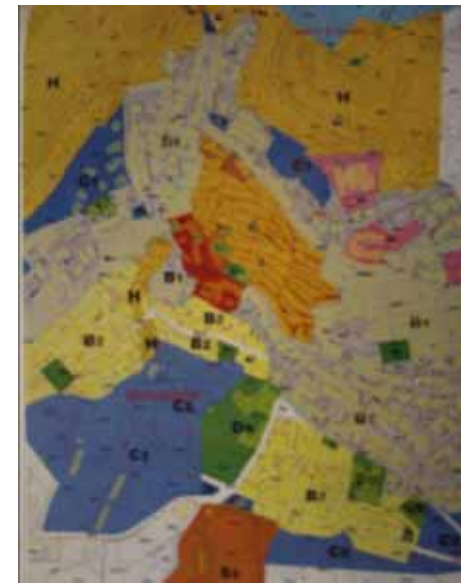
STRUMENTO URBANISTICO VIGENTE – PDF del 1986

Nel PDF del comune di Berchidda è presente la zona A. Il Comune di Berchidda è dotato di Piano Particolareggiato, approvato con Deliberazione del Consiglio Comunale n°32 del 23/03/1992