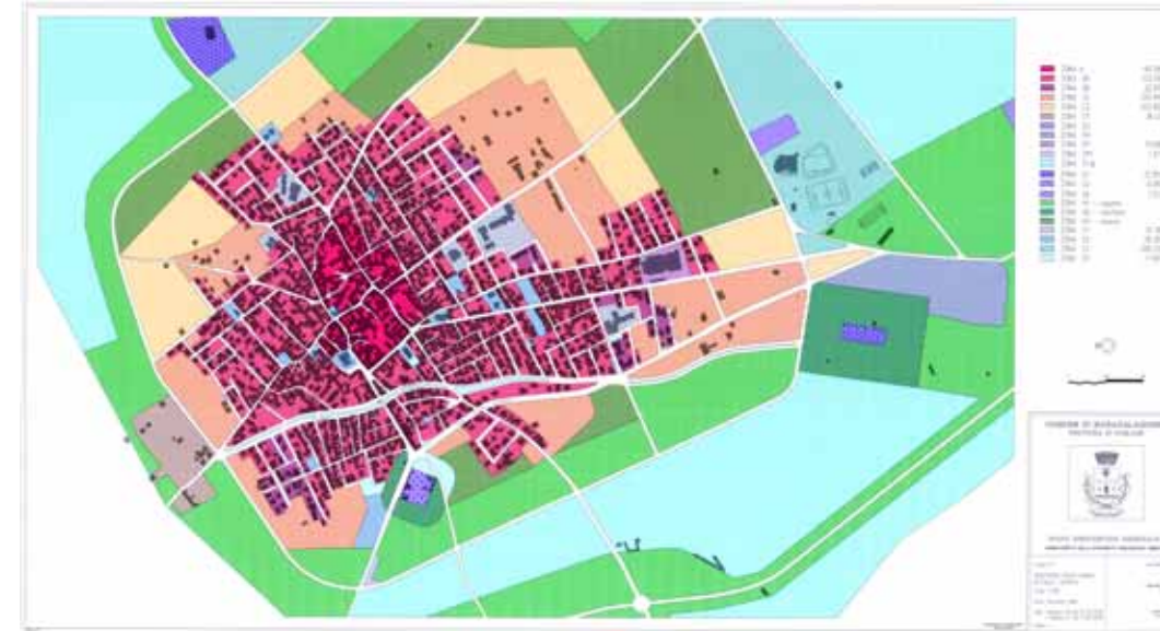
STRUMENTO URBANISTICO VIGENTE – PUC del 2001

Nel PUC del comune di Maracalagonis è presente la zona A. Il Comune di Maracalagonis è dotato di Piano Particolareggiato, approvato con Deliberazione del Consiglio Comunale n° 27 del 17/07/2001