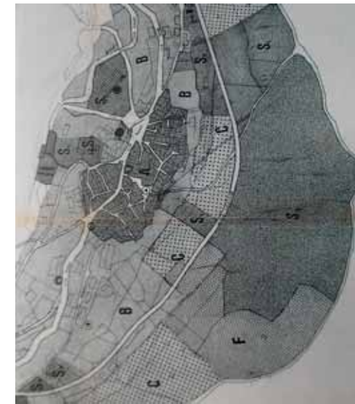
STRUMENTO URBANISTICO VIGENTE – PDF del 1981