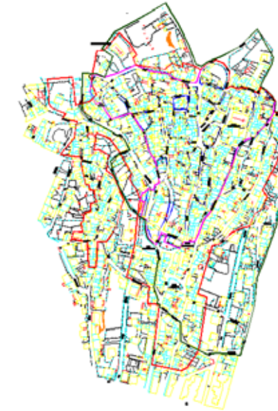
STRUMENTO URBANISTICO VIGENTE – PDF del 1981

Nel PDF del comune di Ardauli è presente la zona A. Il Comune di Ardauli è dotato di Piano Particolareggiato, approvato con Deliberazione del Consiglio Comunale n° 35 del 30/10/1998