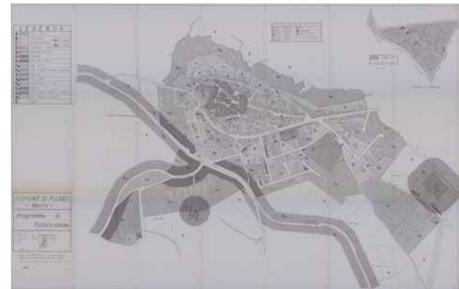
STRUMENTO URBANISTICO VIGENTE – PDF del 1994

Nel PDF del comune di Flussio è presente la zona A. Il Comune di Flussio è dotato di Piano Particolareggiato, approvato con Deliberazione del Consiglio Comunale n° 42 del 16/10/1995