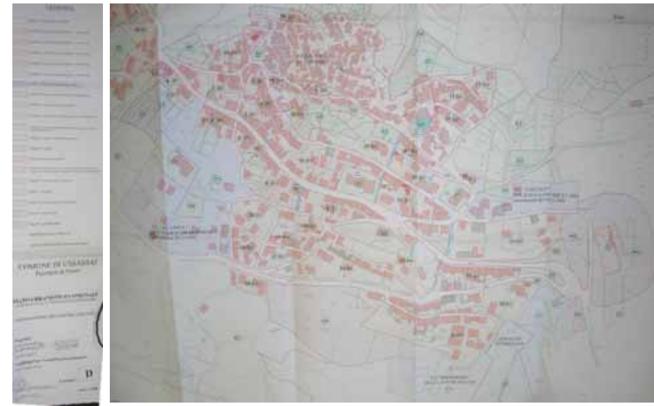
STRUMENTO URBANISTICO VIGENTE – PUC del 2004

Nel PUC del comune di Ussassai è presente la zona A. Il Comune di Ussassai è dotato di Piano Particolareggiato, approvato con Deliberazione del Consiglio Comunale n°20 del 18/07/1987.