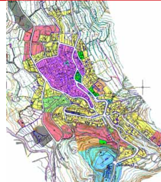
STRUMENTO URBANISTICO VIGENTE – PUC del 2003