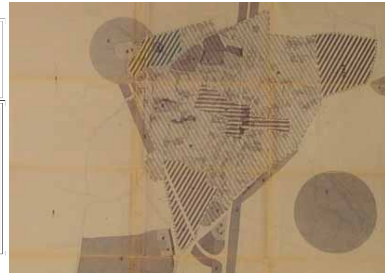
STRUMENTO URBANISTICO VIGENTE – PDF del 1987

Nel PDF del comune di Las Plassas è presente la zona A. Il Comune di Las Plassas è dotato di Piano Particolareggiato, approvato con Deliberazione del Consiglio Comunale n° 17 del 08/07/2002