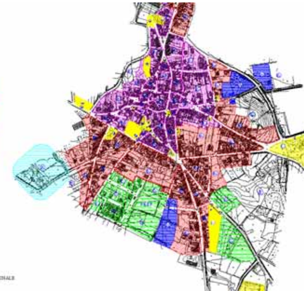
STRUMENTO URBANISTICO VIGENTE – PUC del 1998

COMUNE DI ZEDDIANI Variante al Piano Urbanistico Comunale