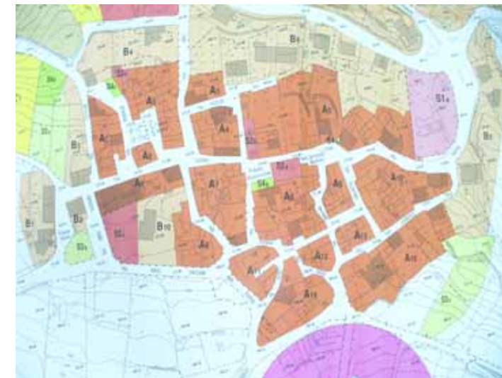
STRUMENTO URBANISTICO VIGENTE – PUC del 2007

Nel PUC del comune di Boroneddu è presente la zona A. Il Comune di Boroneddu non è dotato di Piano Particolareggiato.