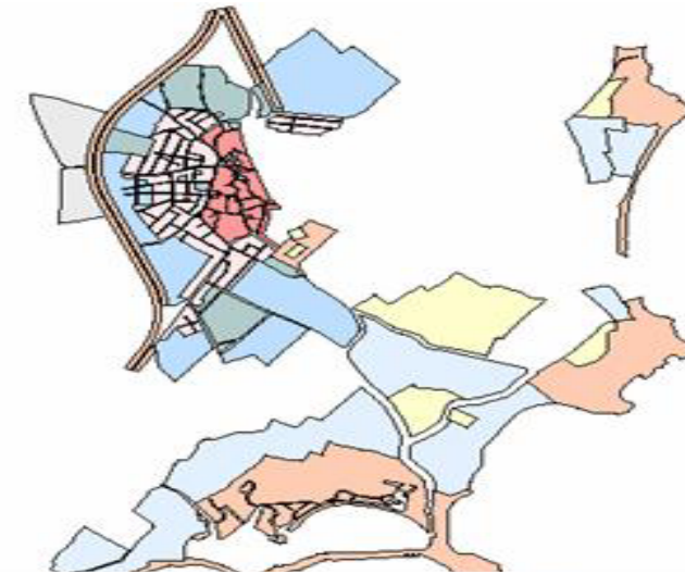
STRUMENTO URBANISTICO VIGENTE – PDF del 1989

Nel PDF del comune di Pula è presente la zona A. Il Comune di Pula è dotato di Piano Particolareggiato per gli isolati 1-2-3-4-5 approvato con Decreto Assessoriale n° 1371 del 28/09/1984; è dotato di Piano Particolareggiato per l'isolato 7 approvato con Decreto Assessoriale n° 1809 del 30/12/1985 ed è dotato di Piano Particolareggiato per gli isolati 6-8-9 approvato con Decreto Assessoriale n° 464 del 27/05/1986