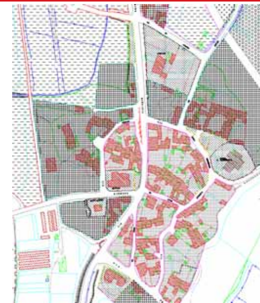
STRUMENTO URBANISTICO VIGENTE – PUC del 2001