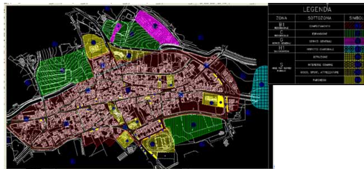
STRUMENTO URBANISTICO VIGENTE – PUC del 1998

Nel PUC del comune di Siamaggiore non è presente la zona A. Il Comune di Siamaggiore non è dotato di Piano Particolareggiato.