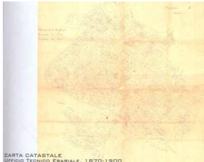
CARTA CATASTALE UFFICIO TECNICO ERARIALE, 1870-1900