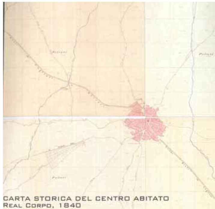
CARTA STORICA DEL CENTRO ABITATO REAL CORPO, 1840

Centro di antica e prima formazione del P.P.R. – verifica del perimetro del centro di antica e prima formazione a scala comunale – perimetro del centro storico nello strumento urbanistico vigente